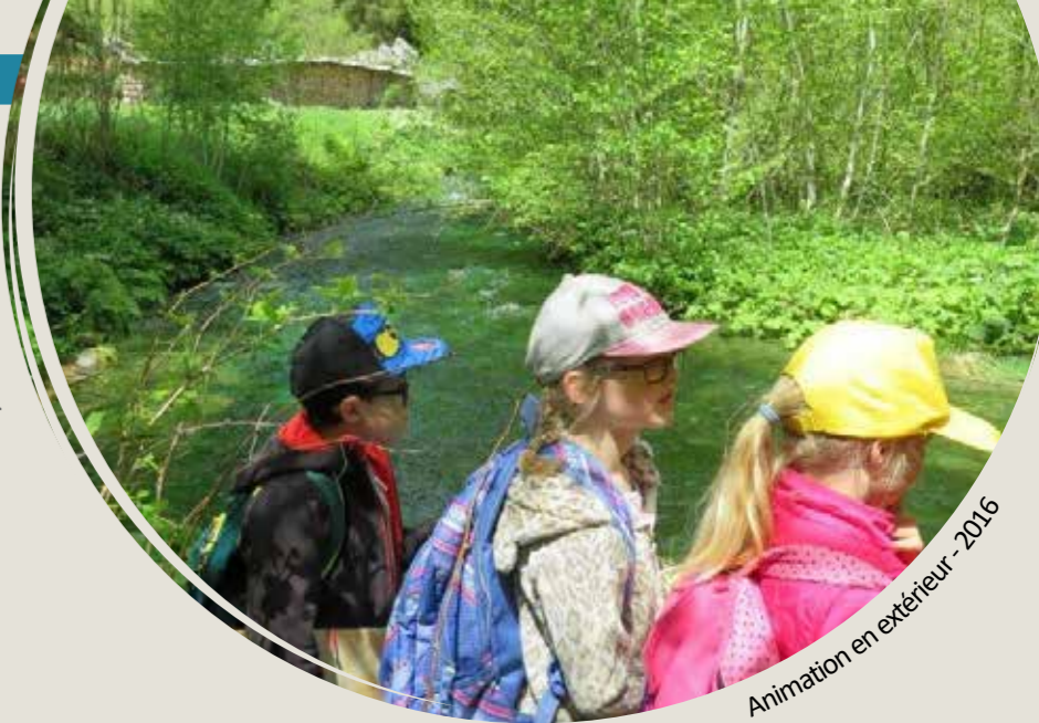
Animation en extérieur - 2016

En 2016, plus de 1900 élèves du bassin versant de l'Arve ont ainsi pu être sensibilisés à l'eau.