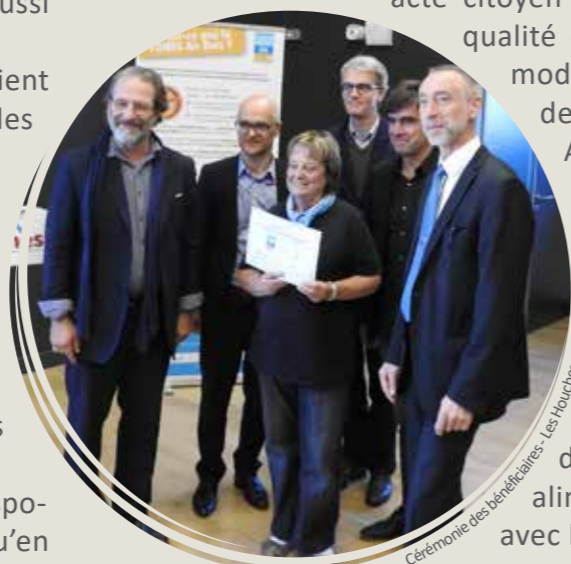
Cérémonie des bénéficiaires - Les Houches

L'occasion, pour les financeurs de les remercier pour leur acte citoyen pour l'amélioration de la qualité de l'air que représente la modernisation d'un appareil de chauffage au bois.