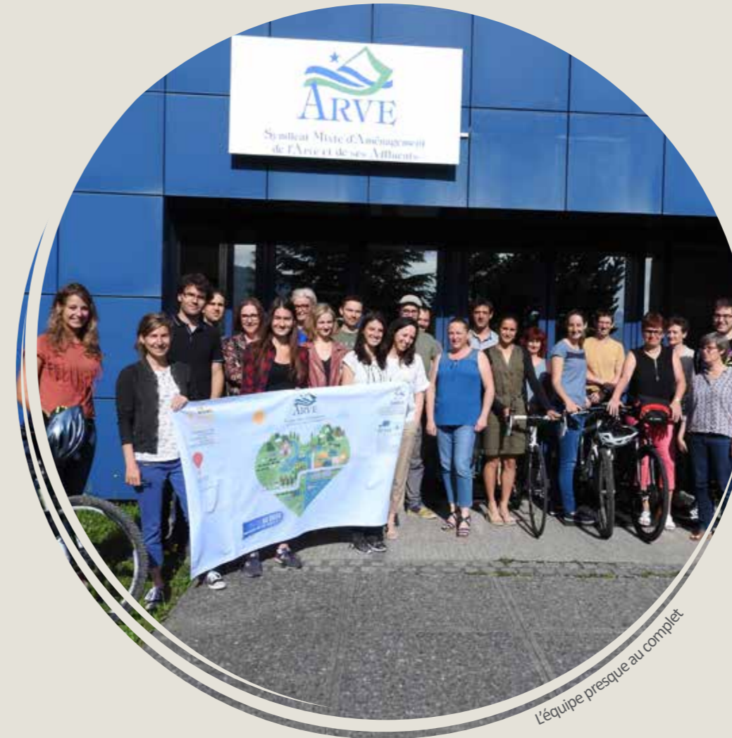
L'équipe presque au complet

En décembre 2016, l'équipe était composée de 25 agents complémentaires, dynamiques et réactifs, prêts à s'investir aux côtés des collectivités territoriales et de ses partenaires pour le bon déroulement de tous les projets programmés.