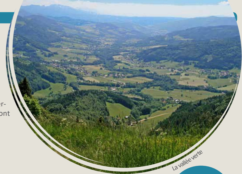
La Vallée verte