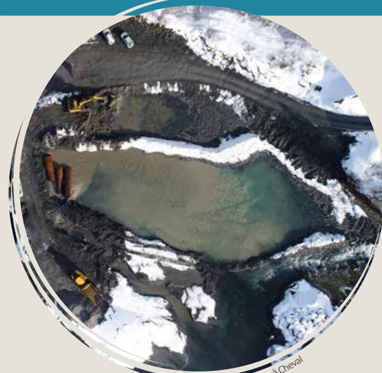
Gorges des Tines - Sixt Fer à Cheval