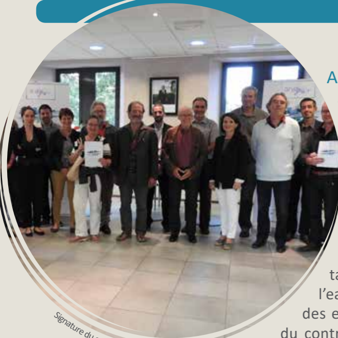
Signature du contrat Arve Pure 2018 par le SRB

ARVE PURE 2018 est une opération collective de lutte contre les micropolluants.