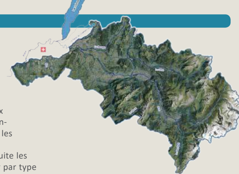
Territoire du SAGE de l'Arve

Le 12 janvier 2016, la CLE s'est réunie pour arrêter la stratégie du SAGE de l'Arve en identifiant 5 grands types d'enjeux sur le territoire.