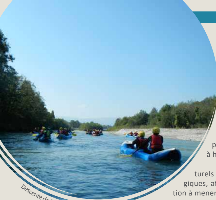
Descente de l'Arve en canoë - Sept. 2016

Lancement d'une réflexion pour un CONTRAT DE TERRITOIRE DES SITES ALLUVIAUX du bassin versant de l'Arve :