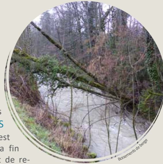
Boisements de berge

Le diagnostic des BOISEMENTS DE BERGE est engagé depuis la fin d'année. Il s'agit de relever l'état des boisements rivulaires et les risques d'embâcles sur les ouvrages (pont, buses...), pour définir les priorités d'entretien des propriétaires riverains ou du syndicat (en cas d'intérêt général ou d'urgence). Ce travail d'arpentage est engagé depuis la fin d'année 2016.