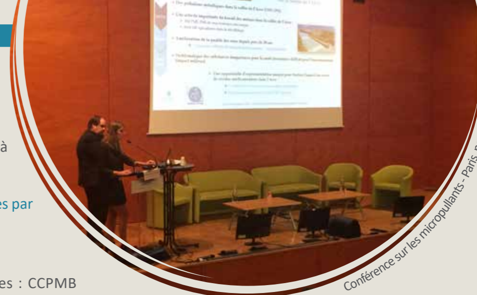
Conférence sur les micropolluants - Paris nov. 16

arve pure 2018 ensemble travaillons autrement