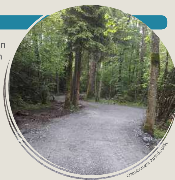
Cheminement Au Fil du Giffre

L'année 2016 a marqué le lancement d'une des actions du contrat de rivière qui vise à mettre en œuvre un CHEMINEMENT DOUX le long du Giffre. Destiné à valoriser le cours d'eau et ses espaces naturels tout en développant les atouts touristiques du territoire sur 44 km entre le Fer à Cheval et Marignier, le cheminement permet aussi d'améliorer l'accès à la rivière et tout en facilitant l'entretien des berges et des ouvrages (passerelles, ponts, digues...). Réalisé par le SM3A en qualité de maître d'ouvrage délégué pour la Communauté de communes des Montagnes du Giffre et le SIVM du Haut Giffre, une première tranche de travaux a permis d'aménager et de réhabiliter l'itinéraire entre la zone artisanale de Taninges et le Lac Bleu de Morillon.