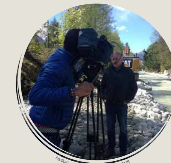
Réalisation de l'émission Agir pour l'eau - BMB

Parallèlement aux actions PAPI, des émissions TV8 Mont Blanc seront produites dans le cadre de l'appel à projet de Ségolène Royal sur la sensibilisation aux risques inondations.