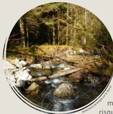
Boisement de berges sur le Borne

Un suivi sera assuré pendant 2 ans par la Fédération de pêche 74 au moyen d'un système de type RFID de détection des poissons, permettant de capter leurs mouvements lors de leur passage à proximité des antennes dont le seuil est équipé.