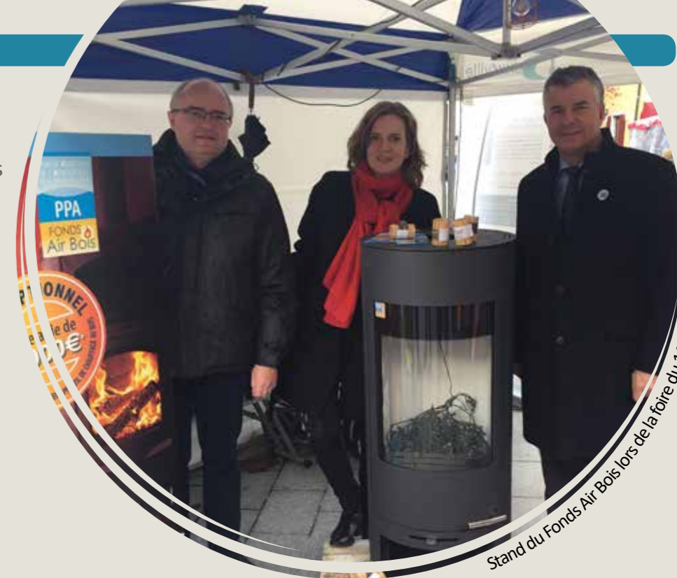
Stand du Fonds Air Bois lors de la foire du 11 nov. - Bonneville