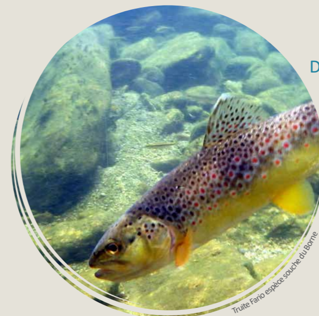
Truite Fario espèce source du Borne

Les élus engagés depuis 20 ans pour la gestion de ce cours d'eau, bénéficieront des compétences du SM3A pour poursuivre.