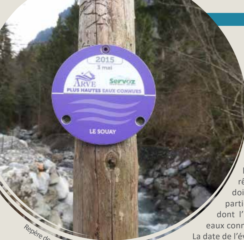
Repère de crue aux Houches

LA POSE DE REPÈRES DE CRUES EST UNE OBLIGATION, QUI S'IMPOSE AUX COMMUNES, PRÉVUE PAR LA LOI DU 30 JUILLET 2003, RELATIVE À LA PRÉVENTION DES RISQUES TECHNOLOGIQUES ET NATURELS ET À LA RÉPARATION DES DOMMAGES.