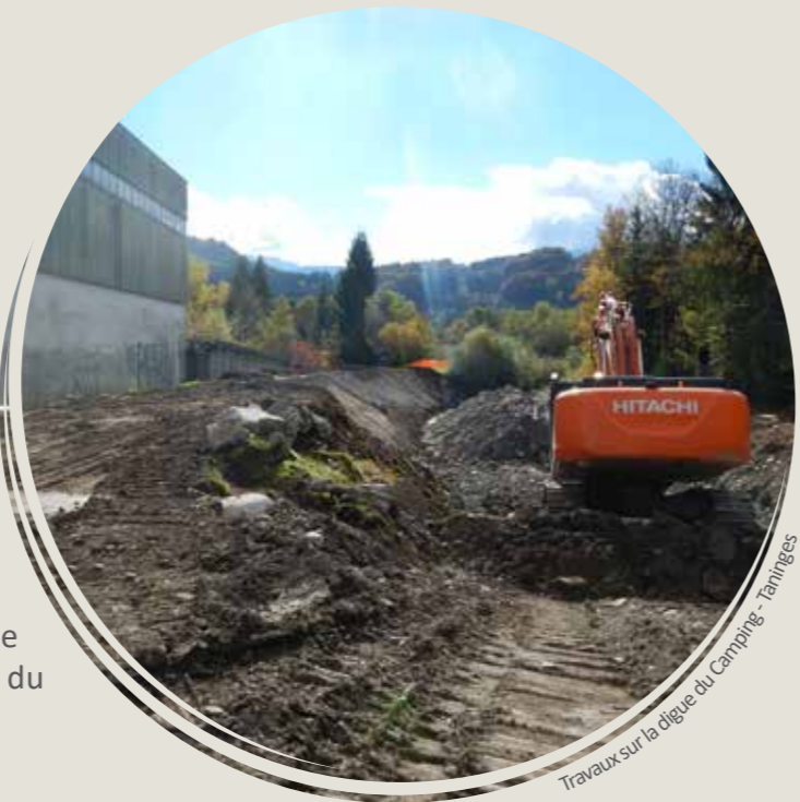
Travaux sur la digue du Camping - Taninges

Ces travaux ont consisté à recréer une protection de pied pour la digue avec la mise en place de blocs d'enrochements et la végétalisation du talus sur sa partie supérieure.