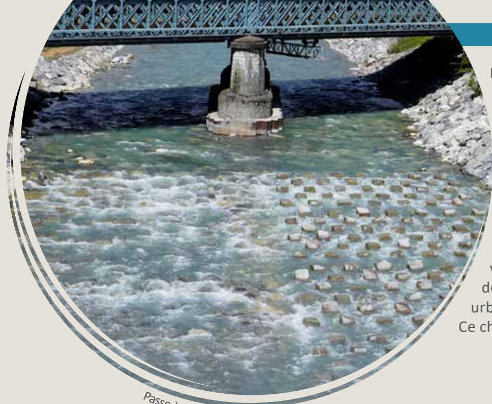
Passé à poisson sur le Giffre

Le SM3A a réalisé en 2016 les travaux de sécurisation des DIGUES DU GIFFRE dans la traversée de Marignier. Il s'agissait suite au diagnostic réalisé en 2008 puis au passage de la crue de mai 2015, de reconstruire les pieds de digues situés entre les deux ouvrages de franchissement. Une nouvelle digue a également été construite en amont du vieux pont pour supprimer les risques de débordement du Giffre dans la zone urbanisée. Ce chantier a également permis de suppri-