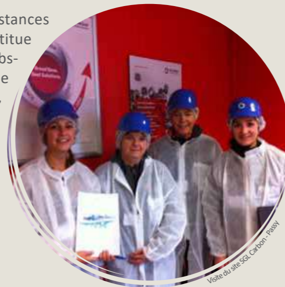
Visite du site SGL Carbon - Passy

le territoire reste une zone d'action prioritaire et la réglementation évolue pour ces substances, tant pour acquérir le bon état des milieux aquatiques, que pour les suivis faits en stations d'épuration.