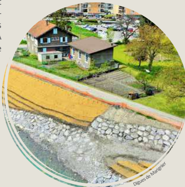
Digues de Marignier

communes et une gouvernance déjà bien établie au travers des commissions de la Commission locale de l'eau (CLE) du SAGE Arve et le comité de pilotage du Programme d'Actions de Prévention des Inondations (PAPI). En cela, la SLGRI du bassin de l'Arve est exemplaire.