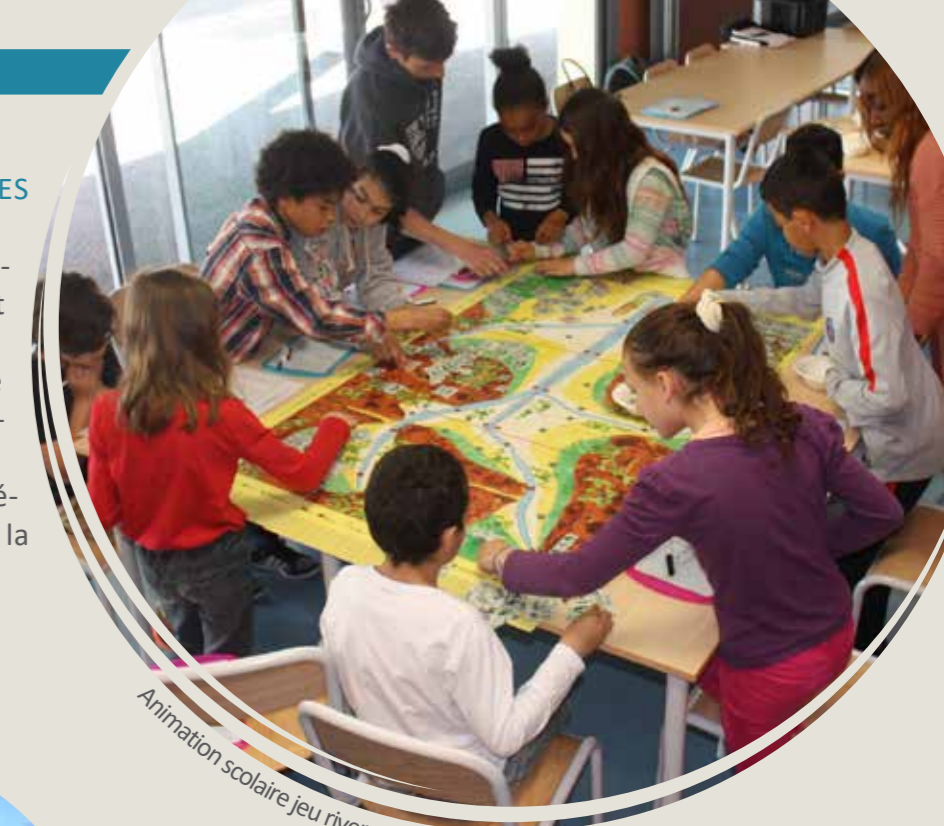
Animation scolaire jeu rivermed

En 2016, 59 repères de crues ont été posés dans 23 communes du bassin versant de l'Arve 34 repères ont été validés dans 13 communes dont 7 ne disposaient encore d'aucun repère. A ce jour ce sont 93 macarons qui ont été posés ou validés dans 30 communes.