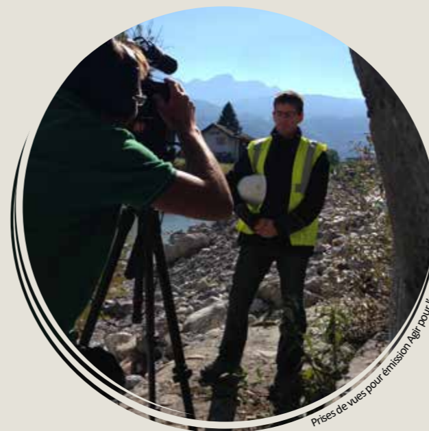
Prises de vues pour émission Agri pour l'eau